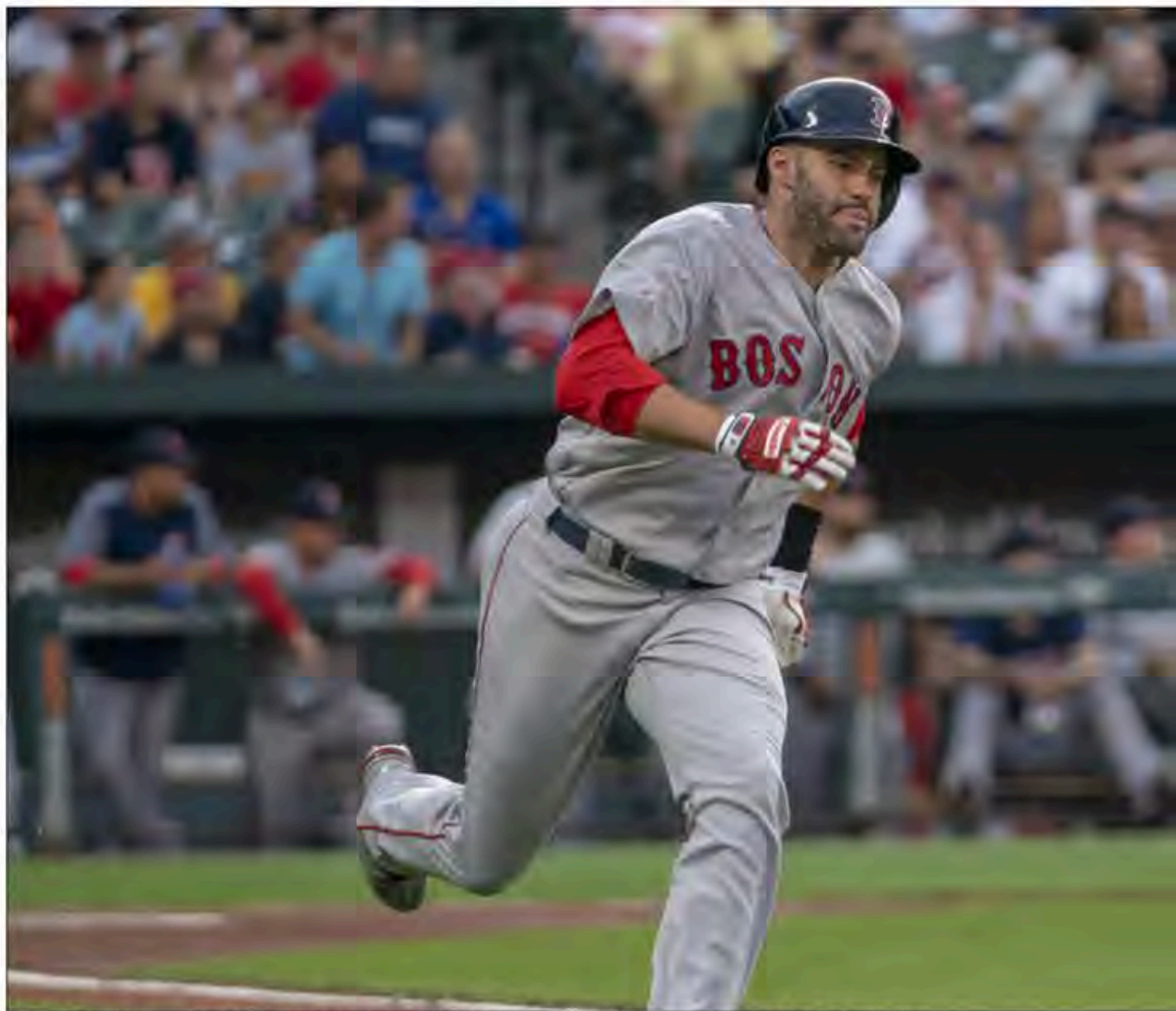
J.D. Martínez, Bateador Designado De Los Red Sox.

BOSTON, MA (AP) - El bateador designado por los Medias Rojas J.D. Martínez ha decidido quedarse en Boston en lugar de convertirse en agente libre, declinando una opción que habría anulado los últimos tres años del contrato que firmó después de que los equipos se hubieran re-